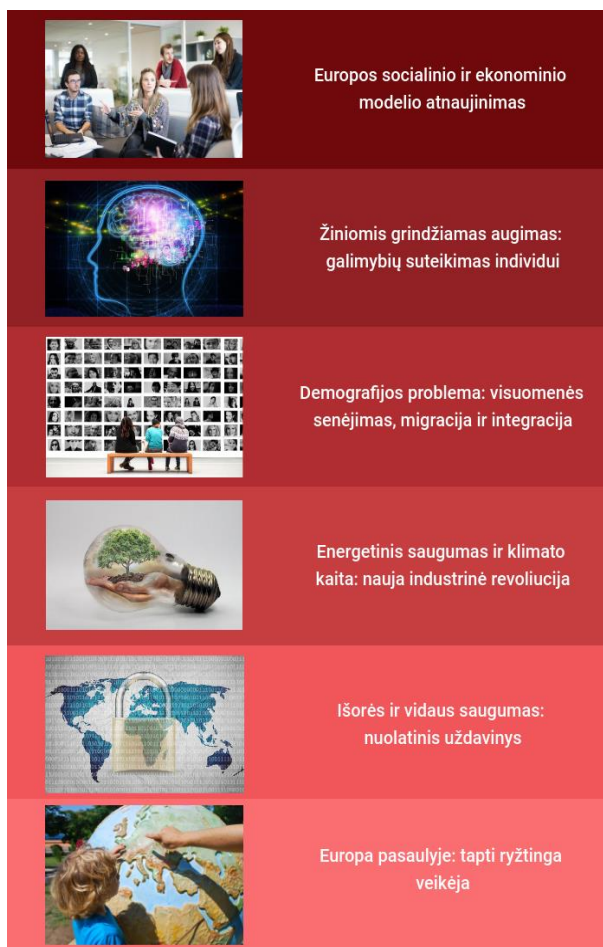
1.2. pav. „Europa 2030“ tikslai

Darnaus ES vystymosi siekiama prisidedant prie projekto „Europa 2030“. Dokumente suformuluoti šeši tikslai (žr. 1.2. pav.).