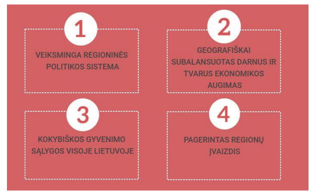
1.7. pav. Nacionalinės regioninės politikos prioritetų iki 2030 metų projektas

Nacionaliniu lygmeniu reikšmingas yra Lietuvos Respublikos regioninės plėtros įstatymas 1 (toliau – Įstatymas), kurio paskirtis – nustatyti nacionalinės regioninės politikos tikslą, jo įgyvendinimo uždavinius, nacionalinės regioninės politikos įgyvendinimą ir finansavimą, teritorijas, kuriose įgyvendinama nacionalinė regioninė politika, regioninės plėtros planavimo dokumentų rengimą ir tvirtinimą, taip pat nacionalinę regioninę politiką įgyvendinančius subjektus ir jų įgaliojimus. Įstatyme nurodomas Nacionalinės regioninės politikos tikslas – mažinti socialinius ir ekonominius skirtumus tarp regionų ir pačiuose regionuose, skatinti visoje valstybės teritorijoje tolygią ir tvarią plėtrą. Vadovaujantis Įstatymo 12 straipsnio 1 punktu, yra parengtas Nacionalinės regioninės politikos prioritetų iki 2030 metų projektas, kuriame suformuoti 4 prioritetai.