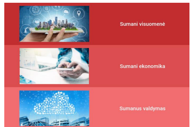
1.5. pav. „Lietuva 2030“ kryptys

Strategijoje išskiriamos pažangai svarbios vertybės – atvirumas, kūrybingumas ir atsakomybė bei 3 pažangos sritys: visuomenė, ekonomika ir valdymas. Siejami įgyvendinti pokyčiai šiose srityse įtvirtins pažangos vertybes ir remsis darnaus vystymosi principais. Pokyčių tikimasi šiose srityse: 1) sumani visuomenė; 2) sumani ekonomika; 3) sumanus valdymas (žr. 1.5. pav.). Prioritetai yra detalizuojami rengiant vidutinio laikotarpio strateginius dokumentus, programas, planus.