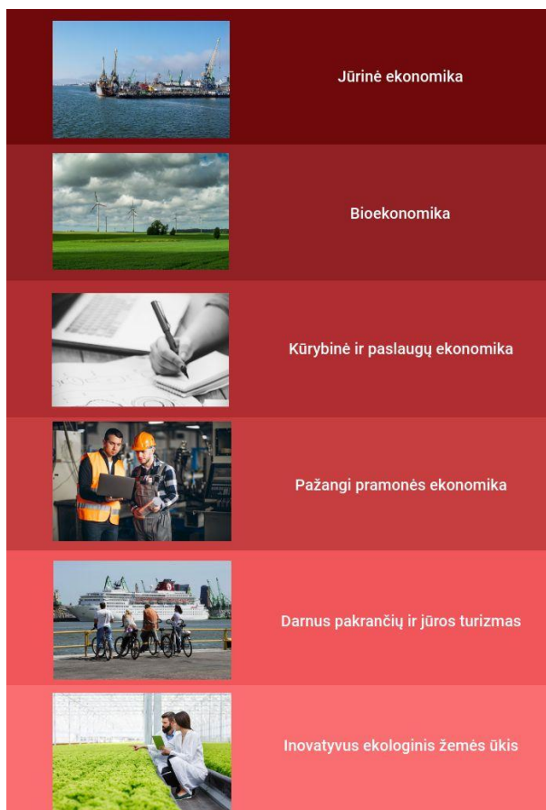
1.8. pav. Klaipėdos regiono specializacijos kryptys

Nacionalinės regioninės politikos prioritetų iki 2030 metų projekte pateikiamos 2018 m. vasario mėn. Klaipėdos regiono plėtros taryboje patvirtintos ir šiuo metu su Lietuvos Respublikos vidaus reikalų ministerija derinamos Klaipėdos regiono specializacijos kryptys (žr. 1.8. pav.).